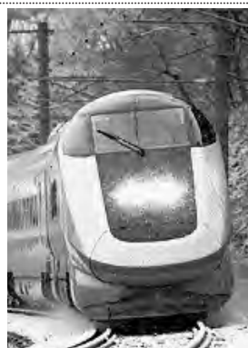
東北の小京都角館へ「秋田新幹線こまち」が便利

来春には、新型車両「E6系」が導入され秋田—東京間は不通になっていましたが、49日の短期間で運転再開をし、現在は、JRと各自自治体の協力により「ディスプレイ」