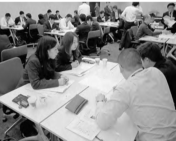
編集会議では見やすい紙面づくりに向け話し合いました

4月20～21日の2日間、方針や取り組みを伝えること、みんなの気持ちをまとめるために必要な情報の提供、組織の行事・取り組みへの参加を促すことなどの役割を担う機関紙を通じて、組織の