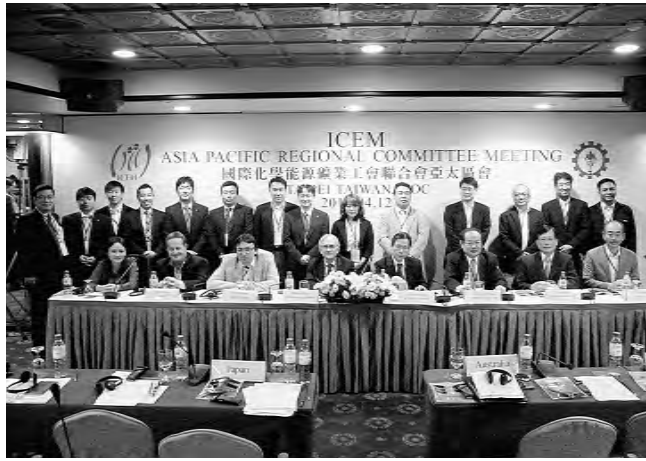
ICEM—アジア太平洋会議の役員と日本から参加者

4月12日に台湾、台北 中央執行委員が出席し、市のハワードプラザホテル台北にてICEM(国際化学エネルギー鉱山一般労連)アジア太平洋地域委員会が開催され、平田MF(国際金属労連)は昨年11月にアルゼンチンで開催された世界大会において、ICEMは今年6月、デンマークで開催される世界大会で解散となることからアジア太平洋地域委員会は今回で最後の委員会となります。