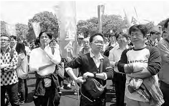
紙パ連合から80名が参加しました

最後に、「リーダー宣言」を満場の拍手によって確認し、徳永会長代行による「がんばろう三唱」にて閉会しました。