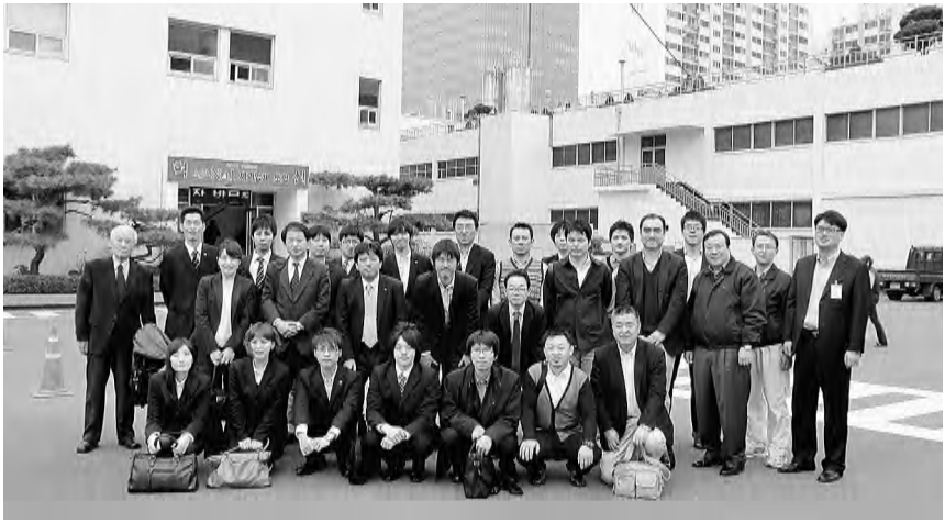
ロッテ製菓の組合役員とともに参加者一同で

今回の海外研修は青年女性委員会と共催で実施し、参加者は組合役員のパテランから青年女性部員までと年齢幅が広く、他の研修では揃うことのない24名のメンバーで構成した海外研修を実施しました。羽田空港での結団式の後、韓国へ出発し、紙パ連合と交流協定を締結している韓国全国化学労働組合連盟の表敬訪問をはじめ、ロッテ製菓の工場見学までと年齢幅が広く、