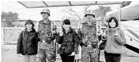
民間人統制区域で兵士と一緒に

印象強く、また、お菓子の試食やお土産などをいただきました。その後、郊外・市内視察では朝鮮戦争が休戦して50年以上が経過した今もなお、半島が荒廃し、緊張状態が解消されていないことなど、韓国の文化に触れる中で多くのことを感じ、学ぶことができました。また、参加者のみぞ知るハブニングもありましたが、全員の柔軟な対応や協力で無事、海外研修を終えることが出来ました。今後、参加者全員が今回の経験を生かしそれぞれの立場で活躍していた