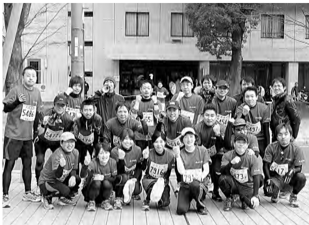
レンゴ—松山「なんちゃってまらそん部」走る前の様子

今回の参加総数はなんと7千352名、そのうち松山工場「なんちゃってまらそん部」から21名が参加しました。参加募集では28名応募したのですが、参加者が多く、イランティア、沿道には参加できなかった方をはじめめ職場やOBの方々が駆けつけてくれました。そのような多くの応援者の声援を背に受けて、21名のうち16名がタイムリミットまでにゴールすることができました。