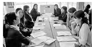
女性特有の課題などを意見交換しました

られました。参加者においては、今後女性が担う役割の大きさを理解し、働きやすい職場づくりの必要性などを十分に理解された有意義なフォーラムになりました。