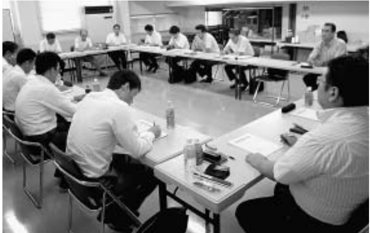
2010年度の活動計画を協議しました。