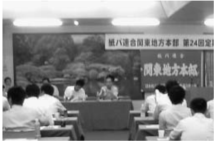
活発な質疑応答が行われました