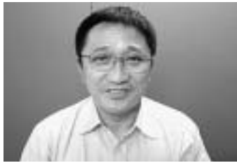
荒木 ひであつ 英篤