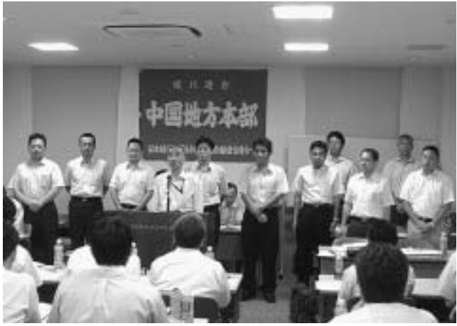
2010年度の新体制を確認しました

【中国地本発】八月十日、岡山シティホテル 大会は活動方針案を厚生町において、第二十四回定期大会が開催されました。総会には、総勢選では三名の方が退任と十四単組三十一名の代議選より執行部に書記次長を配置することにより、業務負担の軽減・効率化を図り、協調性を持ちながら、協同性を発揮し、組織力の強化に努めるとあり、採用の空洞化により衰退しつつある青年女性部の活動についての指摘がありました。各単組の活性化を図り、次代を担う人材発掘のためにも青年の活動がより重要であること紙ケミカル・岩国