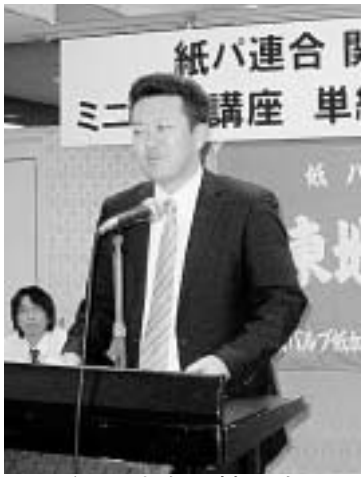
紙パ連合・神田中央副執行委員長