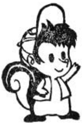
「リッキー」のはんこを作りました

みなさま、「消しゴムはんこ」をご存知でしょうか？消しゴム板を彫刻刀やカッター等を使って作るはんこです。ただ紙に押すだけでなく、カードや封筒へのワンポイント、オリジナルのラッピング用品、専用のインクを使えば食器や布にも押すことができます。