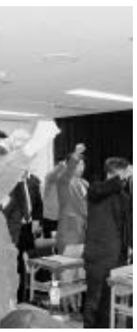
力強くガンパローコール