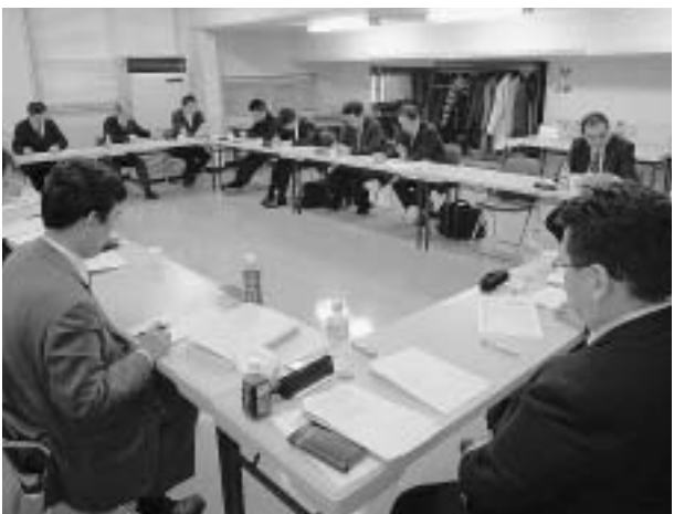
第1回中央闘争委員会で、闘争序盤のとりくみを確認しました

一方、紙パルプ・紙加工産業の現状は、日本経済の悪化をうけて国内需要は依然として低迷している。二〇〇九年紙・板紙の国内出荷は累計で約二千五百六十万トン(暫定値)となり、年間の比較では、対二〇〇八年比が約十三%の減、対二〇〇七年比では約十八%の減となるなど、未だ厳しい状況が続いている。