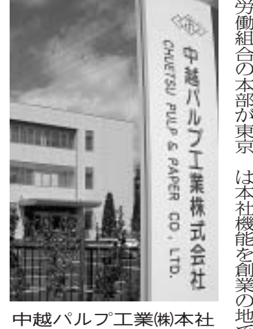
中越パルプ工業(株)本社

引き続き二〇〇九年度の運動方針（案）・予算（案）・その他議案について議案説明を行い、審議の結果、全会一致で可決承認されました。