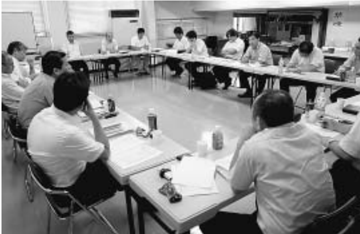
2009年度の活動計画を協議しました

紙パ連合は八月十九日 執行委員長は、「第三十 本部会議室で二〇〇九年 一回定期大会で運動方針 度第二回中央執行委員会 が確立された。課題は山 をひらき、今年度の各種 積しているが、各専門委 機関・委員会の構成や秋 員会を中心に充分に議論 季闘争のとりくみなど主 して更なる運動の発展を 要な活動について確認し 目指そう」、「衆議院選 ました。 挙が始まった。大会で確 会議の冒頭、鈴木中央 認したように、民主党を