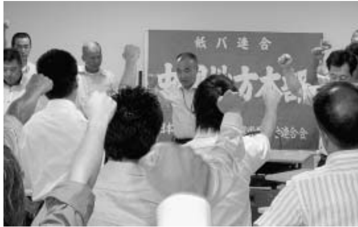
出席者全員による力強いガンバロウコール