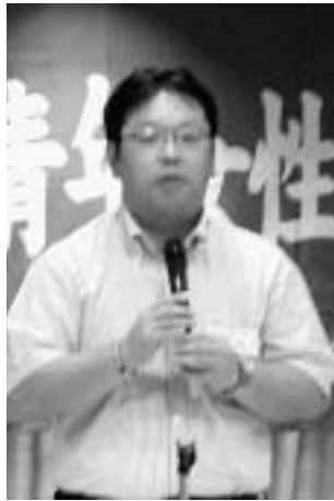
前田委員長・青年女性委員会担当役員

いづれにしてもこれからの労働組合を担っていく人材の実践教育という観点から、こうした活動は非常に重要であると考えますので、今後とも各単組・支部の暖かいご理解とご協力をお願い致します。