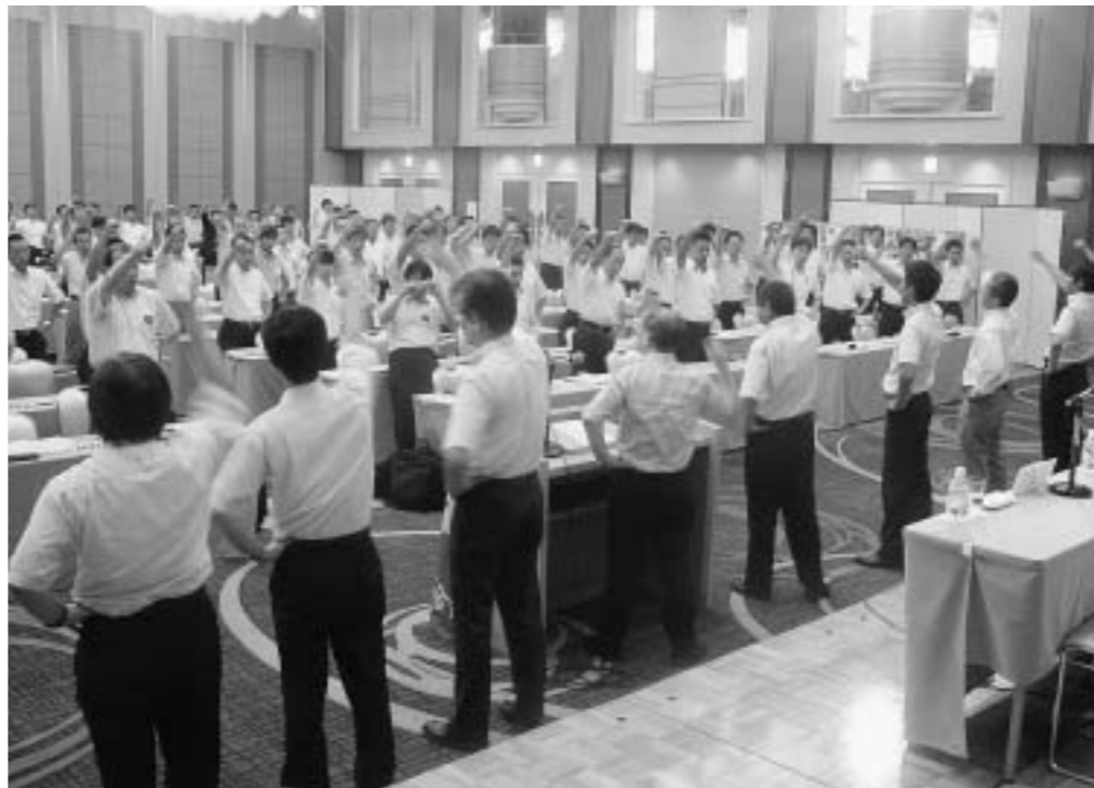
団結カンパローで連帯を強めることを誓いました

定期大会での意見・質問をまとめた質疑応答の内容を紹介いたします。なお、紙面の都合で内容を要約しています。