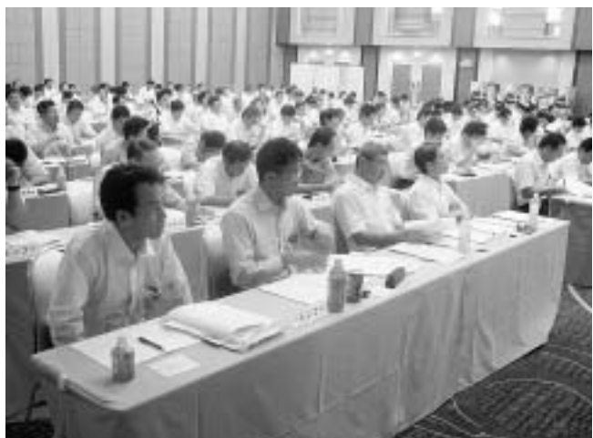
総勢208名が参加しました